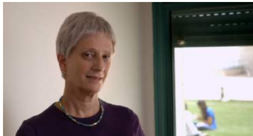
Pr Irit Meir Laboratoire de recherche de langue des signes Université de Haïfa